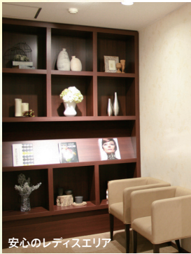
安心のレディスエリア