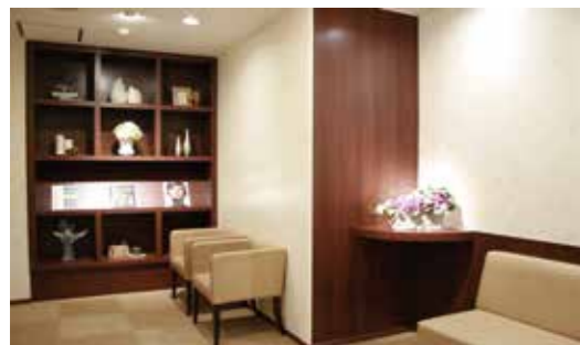
レディスエリア(総合健診センター)