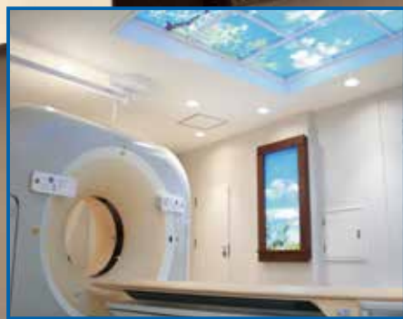
最新モデル 128slice (64列 MDCT)